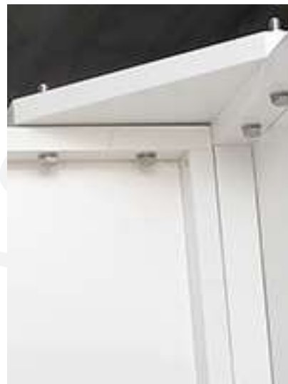
Viti montaggio squadre centrali