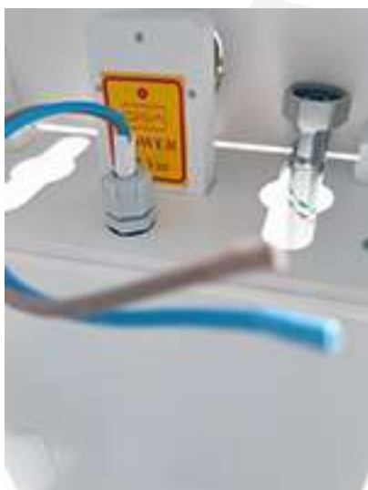
Particolare fili alimentazione 12vac e raccordo flessibile per ingresso acqua