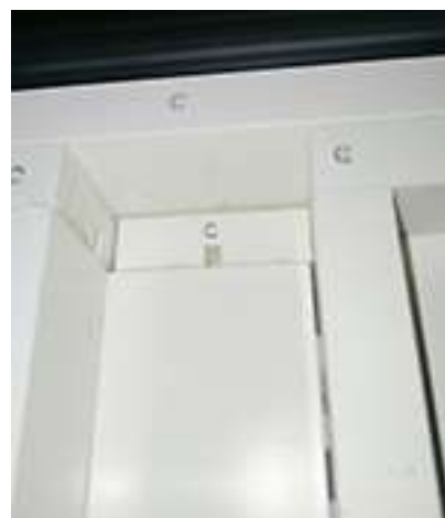
Viti particolari punto C