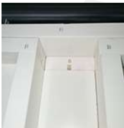
Viti particolare punto B