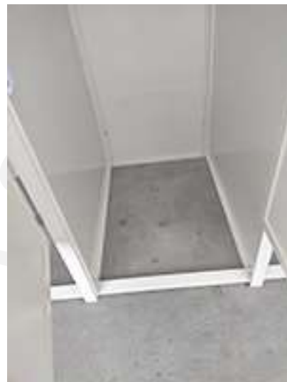
Particolare distanziatore centrale B1