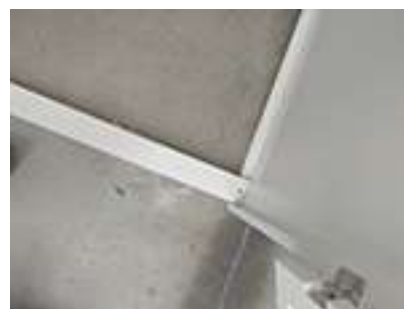
Particolare distanziatore destro A1