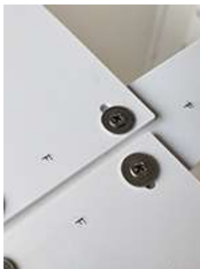
Particolare viti fissaggio angolari 3mm in alto.