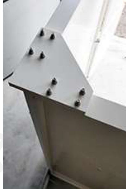
Posizionamento squadra singola