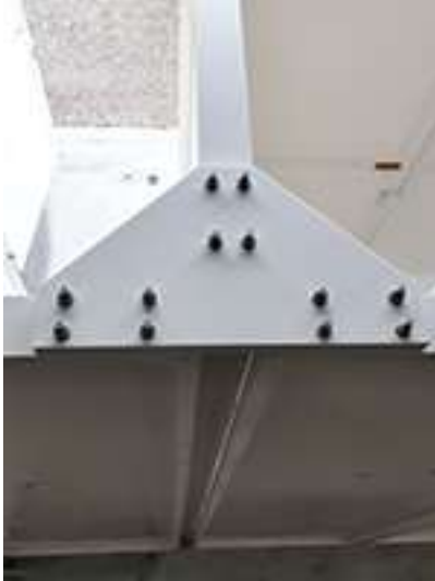
Posizionamento squadra doppia