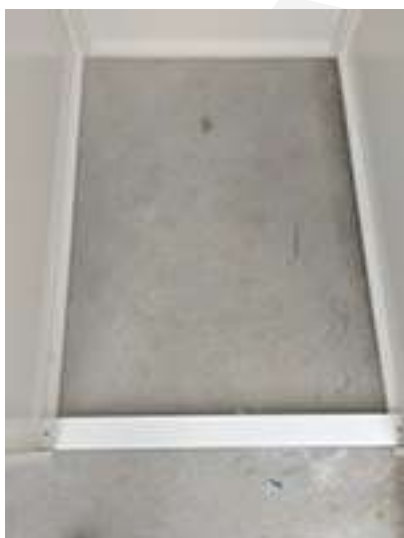
Particolare distanziatore centrale B1