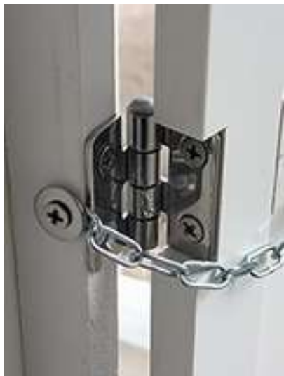
Particolare catenella e cerniera porte