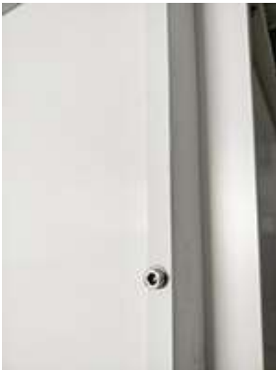
Viti )fissaggio pannelli (Part. D-H