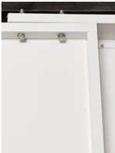
Viti montaggio squadre laterali