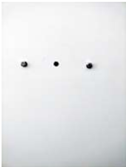
Particolare viti inferiori fissaggio ISCHIA