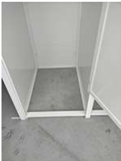
Particolare distanziatore sinistro C1