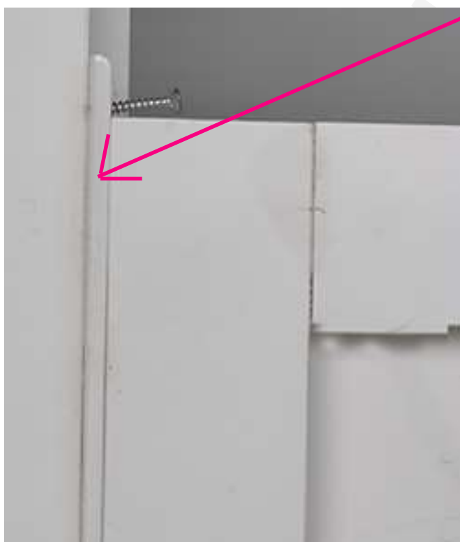
Particolare chiavistelli porte